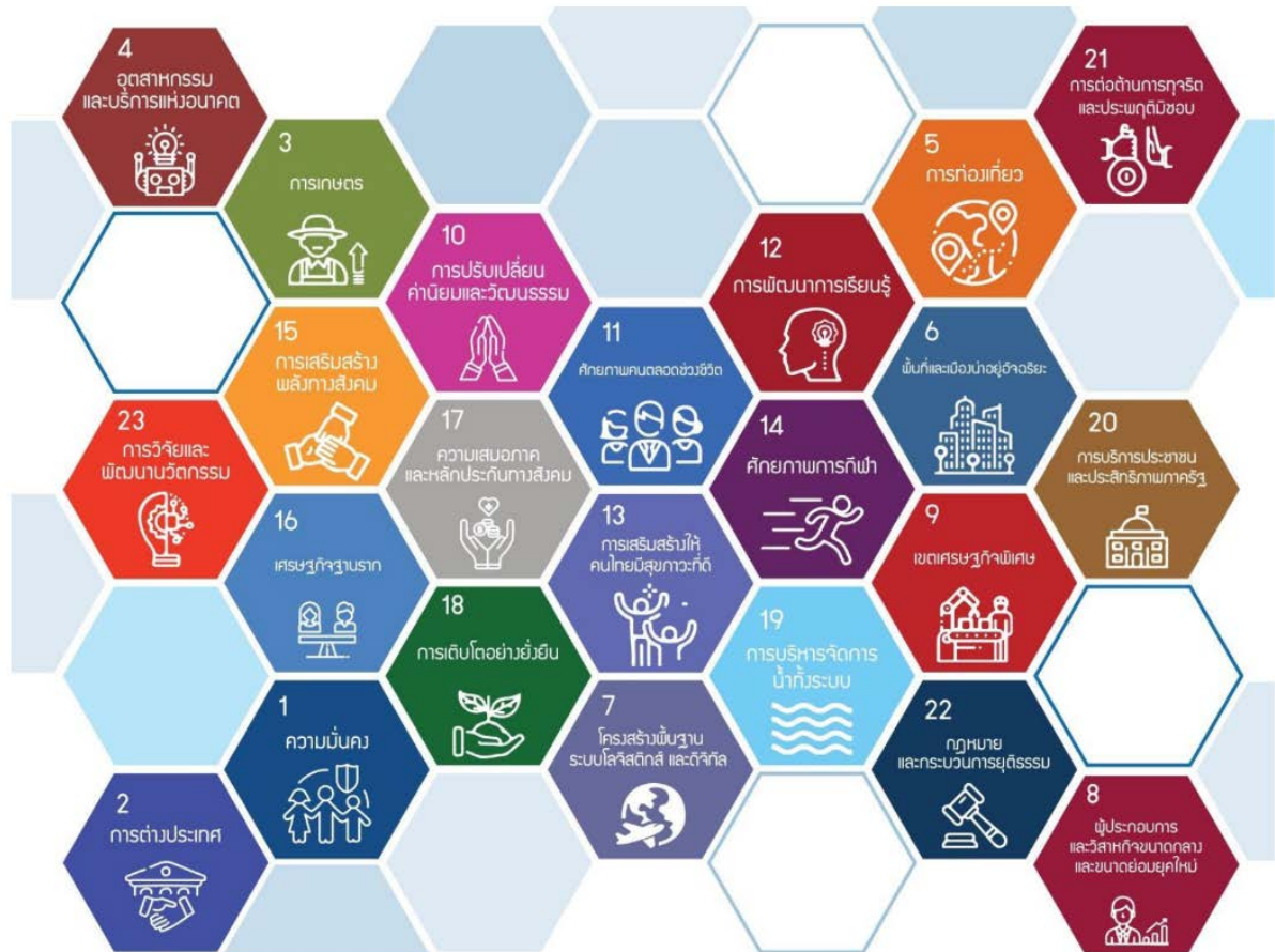
แผนแม่บทยุทธศาสตร์ชาติ ๒๓ แผน

กองทุนความปลอดภัย อาชีวอนามัย และสภาพแวดล้อมในการทำงานเริ่มดำเนินการตั้งแต่ ปี พ.ศ. ๒๕๕๔ โดยได้มีการทบทวนและจัดทำยุทธศาสตร์ให้สอดคล้องกับนโยบายรัฐบาล และสอดคล้องกับหน่วยงานต้นสังกัด